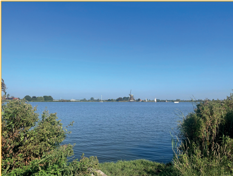
Uitzicht vanaf het bankje aan de zuidzijde Wijde Aa met zicht op de Veendermolen

Het antwoord is dan natuurlijk de alom bekende koffiestop in Hoogmade waar we zo graag aan het water koffiedrinken met een verwarmd (!) appelpuntje. Maar het antwoord is ook het vaarwater dat de Wijde Aa aansluit met de Oude Rijn in Zoeterwoude-Rijndijk.